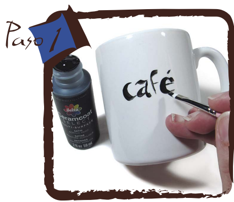
A mano alzada escribe café con unas bonitas letras, usando la pintura negra SELECT Ref: 4099