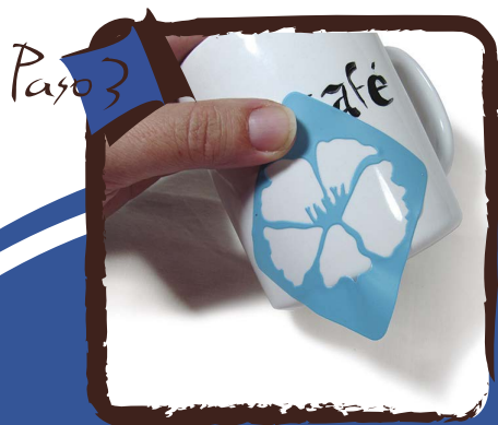
Adhiere la plantilla sin pliegues a la superficie de la taza. Procura que las letras estén bien secas.