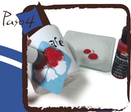
Con uno de los pinceles de estarcir Martha Stewart pinta con SELECT Ref: 4004 dando pequeños toques.