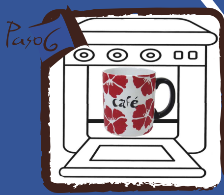
Para fijar el color meter en horno frio. Calienta hasta 350°, mantén media hora y dejar enfriar dentro.