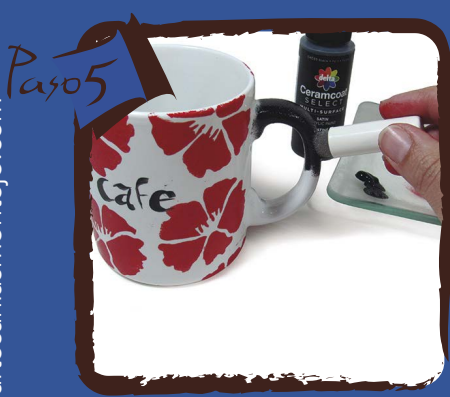
Despues de decorar toda la taza con la plantilla de flores, pinta el asa de la taza con el color negro.